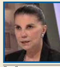
Escribe: BERIT KNUDSEN

Los países buscan soberanía económica y cooperación estratégica