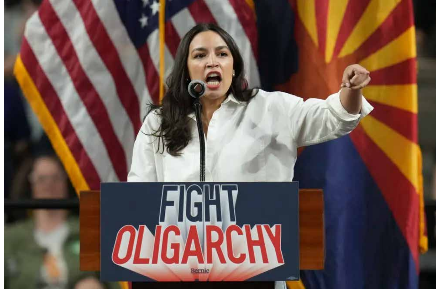
Alexandria Ocasio-Cortez habla en la gira "Combatir la oligarquía".

"Encuestamos a más de 160 economistas estadounidenses y descubrimos que el 96% se opone a las propuestas superiores a 20 dólares la hora", declaró Paxton a Fox News Digital, añadiendo que la preocupación es especialmente marcada en sectores con márgenes reducidos, como la hostelería y la restauración, donde el aumento de los costos laborales podría provocar la pérdida de empleos y dificultar la actividad empresarial.