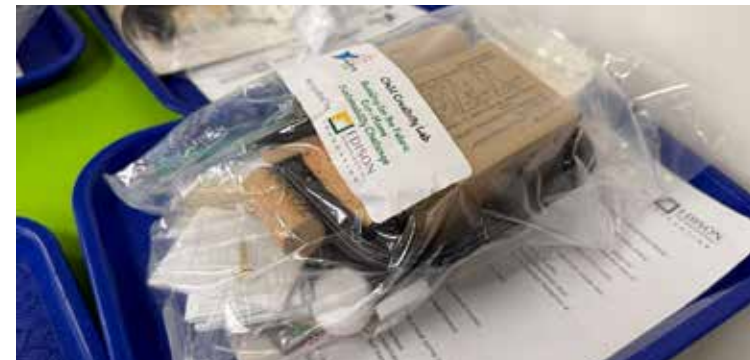
Los materiales reciclados proporcionados a través de los kits STEAM de Child Creativity Lab ofrecen a los estudiantes una nueva forma de aprendizaje y el diseño.

yo era joven, era casi al revés: éramos buenos con las herramientas, pero tuvimos que aprender a usar las computadoras más tarde. Experiencias como esta ayudan a recuperar el equilibrio entre esas habilidades».