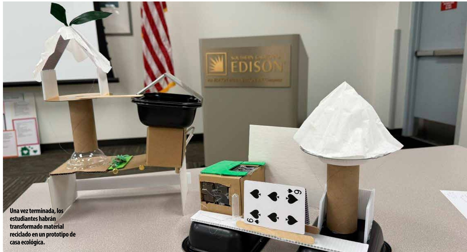
Una vez terminada, los estudiantes habrán transformado material reciclado en un prototipo de casa ecológica.